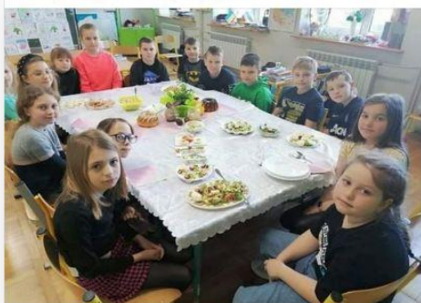
Wesołych Świąt Wielkanocnych życzy kl. III b