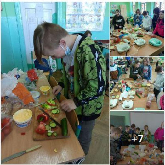
Zajęcia integracyjno-kulinarne na godzinie wychowawczej w klasie 7a.